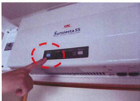
②パワーコンディショナの「運転/停止」スイッチを「切」にする