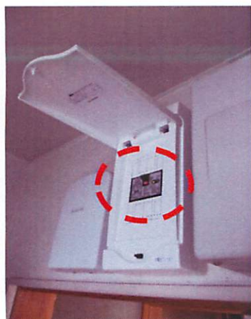
③太陽光ブレーカーを「ON」にする