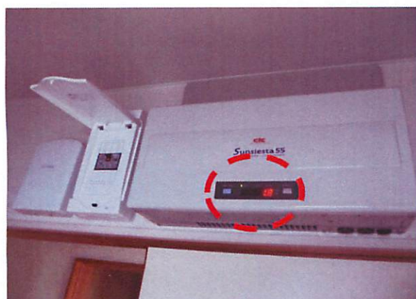
⑤300秒のカウント終了後、連系ランプが点灯 発電量が表示さへ

自立運転機能の使用中は系統連系(売電)がされておりません。 停電や災害時に使用したのち、復旧した際には必ず、 自立運転機能から系統連系へ戻す よう、ご注意願います。