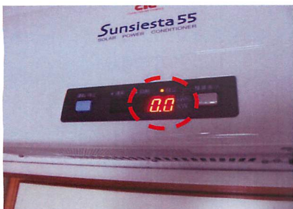
①自立運転機能時の表示 自立ランプが点灯し「0.0」と表示されています