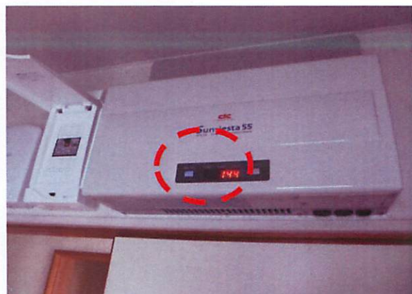
④パワーコンディショナの「運転/停止」スイッチを「入」にする ⇒連系ボタンが点灯し、300秒のカウントが始まる